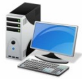
Ordinateur de bureau